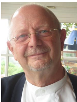
Auteur Manfred J. Poggel